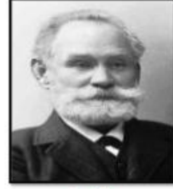
بافلوف صاحب نظرية الأشرط الكلاسيكي حاز على جائزة نوبل في الطب

وقد تأثرت هذه المدرسة بالوضعية العلمية وفلسفة الولايات المتحدة الأمريكية في بداية القرن العشرين، وقد ركزت على فكرتين أساسيتين هما: السلوك الملاحظ والبيئة، مع إقصاء الذات والعواطف الشعوية والعمليات الذهنية والعقلية والفكرية الداخلية.