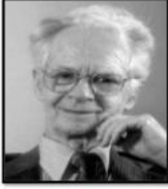
سكينر صاحب نظرية الأشرط الأجرائي