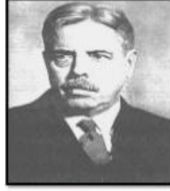
ثورنديك صاحب نظرية التعلم بالمحاولة والخطأ